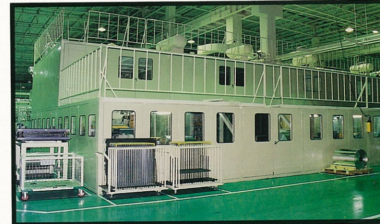
HI-SPEED PRESS MACHINE STAMPING PRESS MACHINE PUMP AND BLOWER TEST ROOM ETS...